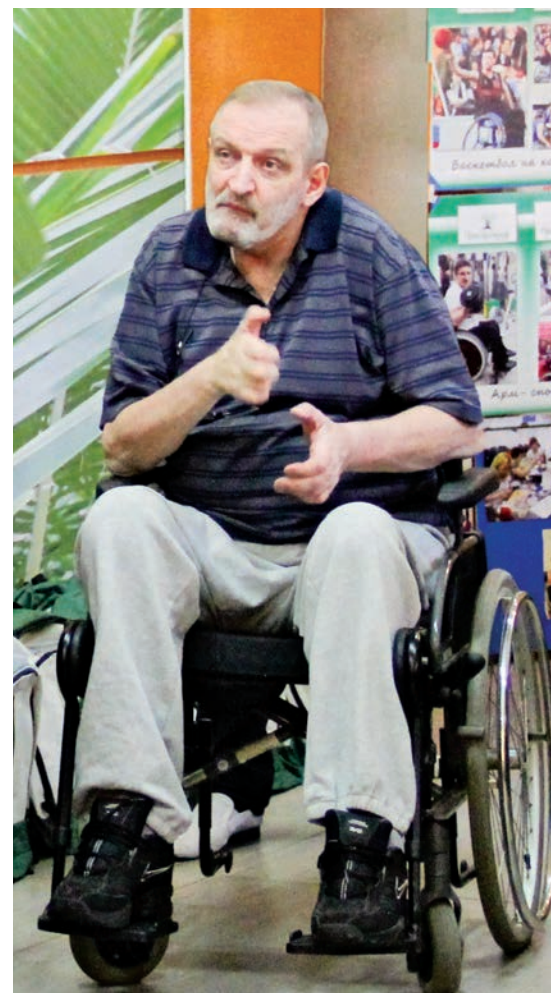
Главный судья фестиваля, знаменитый советский хоккеист Виктор Жлуктов

Легендарный вратарь советской сборной по хоккею Владислав Третьяк, обладатель 86 золотых на-