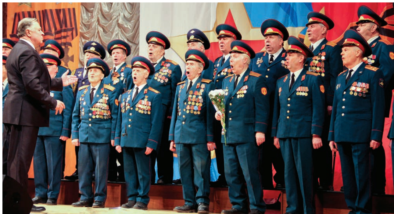
Академический мужской хор ветеранов войны, труда и военной службы Московского Дома ветеранов войн и Вооружённых Сил

Словно высокой плотной волной накрывал фантастический звук – необыкновенно богатый, мелодически мощный и при этом чрезвычайно искренний. В пении а капелла слышались былинные мотивы, возникали