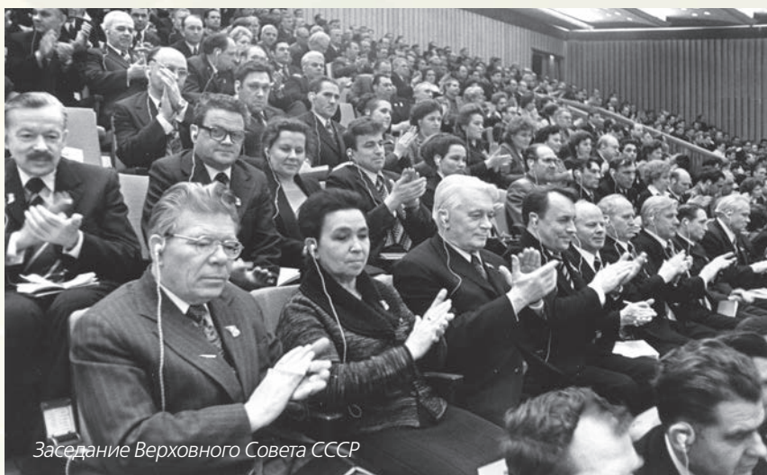
Заседание Верховного Совета СССР

– Это мне подарила Бандаранаике, премьер-министр Цейлона. Такая интересная была дама! Всю историю нашей компартии выучила, её страшно интересовали подробности, и хоро-