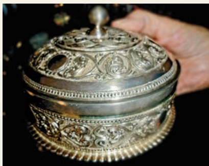
Серебряная шкатулка от Бандаранаике

– Я в своё время была единственной женщиной-министром, членом ЦК КПСС, потому ездила на все международные женские съезды и в Европу, и в Африку, и в Латинскую Америку. Только в Австралии вот никогда не была. Андрей Андреевич Громыко, будучи министром иностранных дел, брал меня на сессии Генеральной Ассамблеи ООН. Дважды я была в Нью-Йорке в составе нашей делегации, работала в Социальном комитете. По любому документу, который там принимали, я должна была вносить свои предложения, отстаивать позицию СССР по всей вопросам. Мы сидели рядом с азиатскими делегациями.