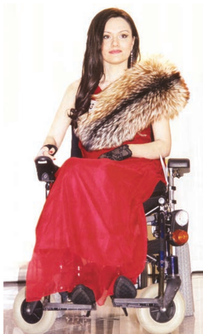
Участница конкурса «Мисс Театр»

Основная цель терапии – обучить пациента навыкам и движениям, которые ему пригодятся в жизни, помочь ему интегрироваться в общество. Для этого периодически, не реже одного раза в 3–6 месяцев, производится ротация стационарных и нестационарных этапов реабилитации с периодом самостоятельных тренировок пациента