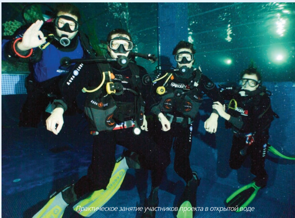
Практическое занятие участников проекта в открытой воде

Подводное плавание рассматривается как метод воздействия на личностный рост человека с ограничениями по здоровью. Инструкторы