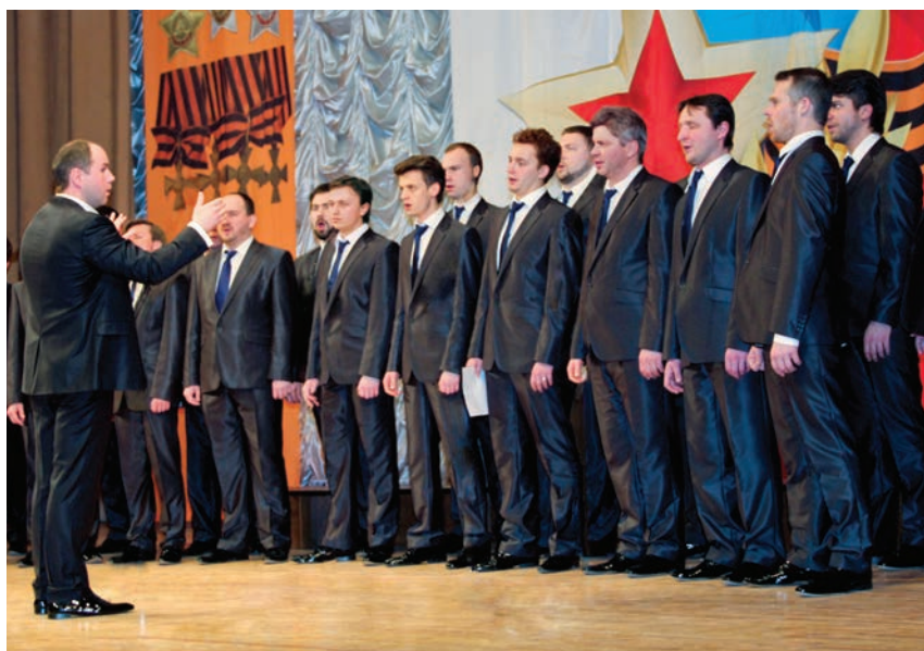
Хористы Сретенского монастыря

С нескрываемым интересом все ждали выступления Мужского хора Московского Сретенского монастыря, который не имеет аналогов в мире. В 2005 году с благословения архи-