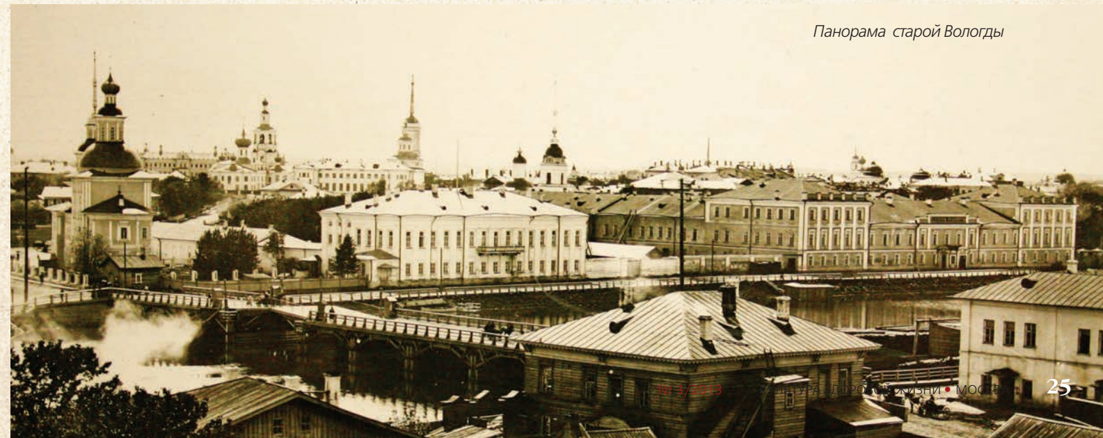
Панорама старой Вологды