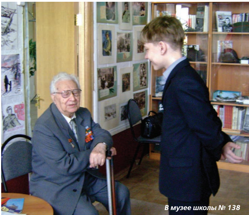
В музее школы № 138