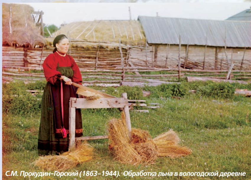
С.М. Прокудин-Горский (1863–1944). Обработка льна в вологодской деревне

Отец мой работал лесосплавщиком, а зимой уходил на заработки в Архангельск. И, как в сказке «Аленький цветочек», привозил нам с сёстрами долгожданные подарки: колотый сахар, пшеничный хлеб. До сих пор помню, как получила я в подарок башмаки со шнурочками! Вот уж всем подаркам был подарок! Для деревенской детворы, выросшей среди дремучих лесов, это была невидаль, более дивная даже, чем северное