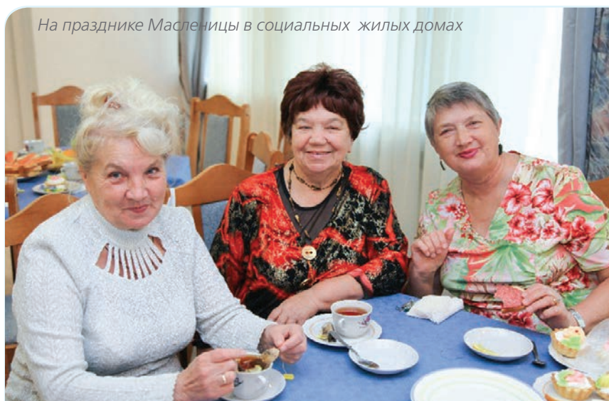
На празднике Масленицы в социальных жилых домах