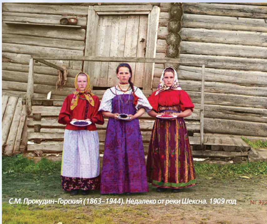
Недалеко от реки Шексна. 1909 год