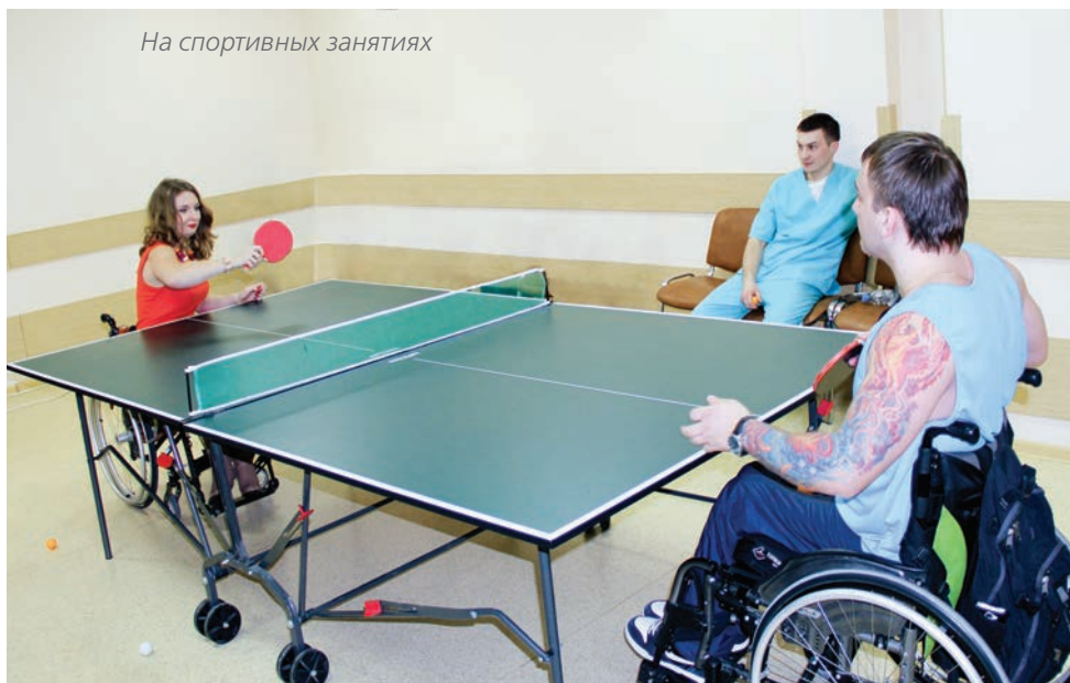
На спортивных занятиях

вязальному, переплётному делу и фотомастерства.