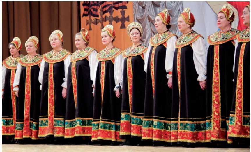
Ансамбль «Ещё не вечер...» (филиал «Люблино» ТЦСО №18, ЮВАО)