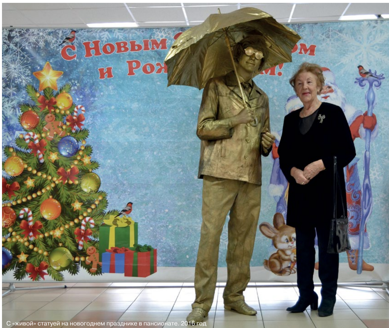
С «живой» статуей на новогоднем празднике в пансионате. 2016 год

В 1945 году началась долгожданная мирная жизнь. Папу перевели сначала в Ленинград, затем в Москву с большим повышением в Министерство обороны СССР. Он был уже в звании полковника. Потом стал генералом. Получили квартиру на Ленинградском проспекте, 75, в легендарном Доме воинской славы на Соколе, который еще называют генеральским. Родители были контактными людьми. Наша квартира всегда была полна друзей и знакомых.