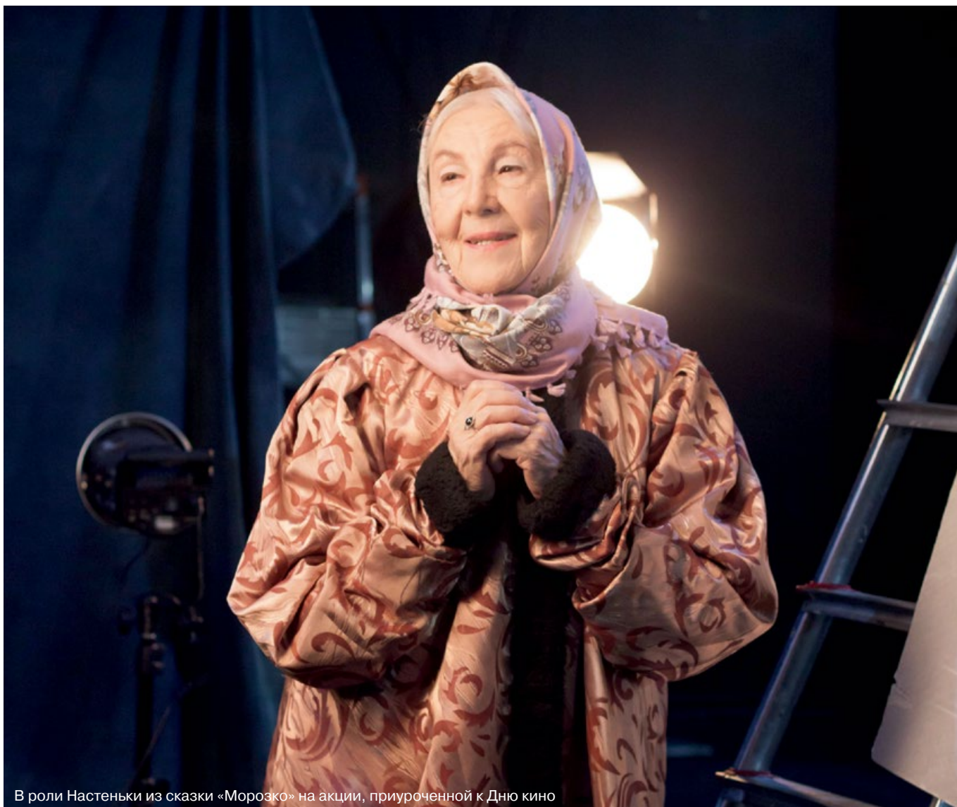
В роли Настеньки из сказки «Морозко» на акции, приуроченной к Дню кино

получал второе высшее образование в Военной дипломатической академии, в которой я стала преподавать и где проработала более 20 лет.