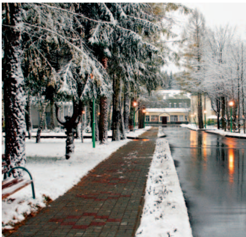
Пансионат для инвалидов с ментальными нарушениями №33

С 2008 года в Москве реализуется проект Городской телефонной диспетчерской службы инвалидам по слуху с помощью факсимильных сообщений, SMS-сообщений, электронных сообщений, входящих вызовов с телефонных номеров сети общего пользования (фиксированных и мобильных). В этом году услугами этой службы воспользовались около трех с половиной тысяч инвалидов по слуху. В рамках работы диспетчерской службы оказываются услуги по передаче информации посредством видеотелефона. Этой формой услуги в 2012 году вос-