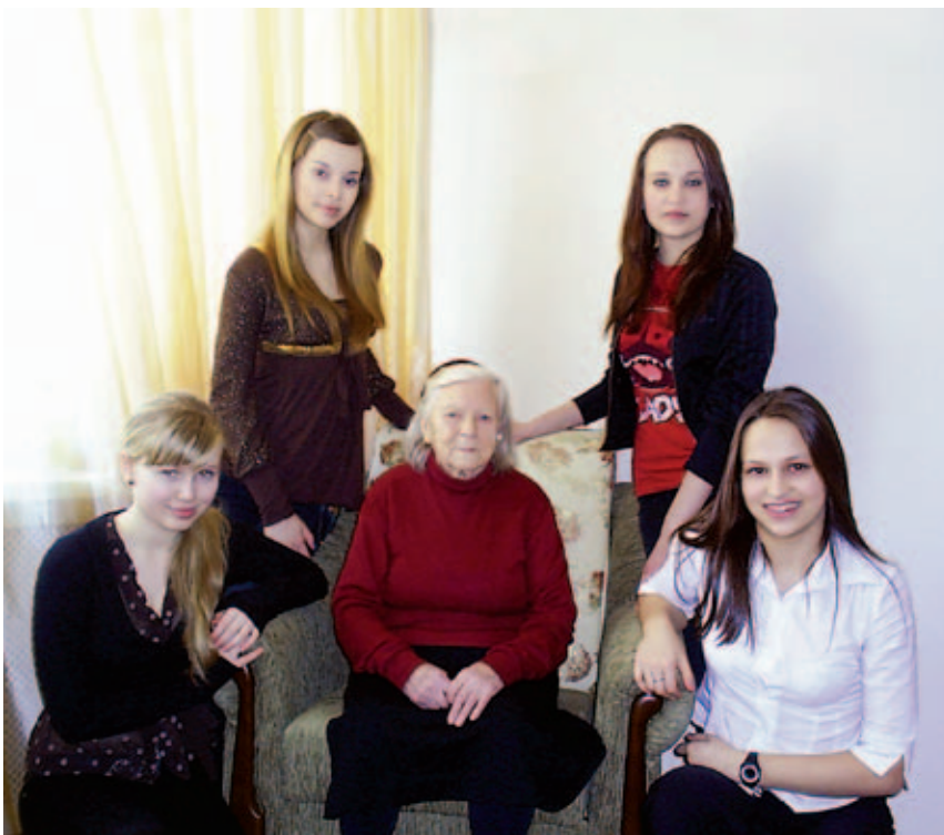
Забота о старшем поколении – приоритет Правительства Москвы

А на второй день участники Международного форума лично ознакомились с работой ведущих учреждений Департамента социальной защиты населения города Москвы, с инновационными методиками и технологиями, которые применяются в столице для реабилитации инвалидов.