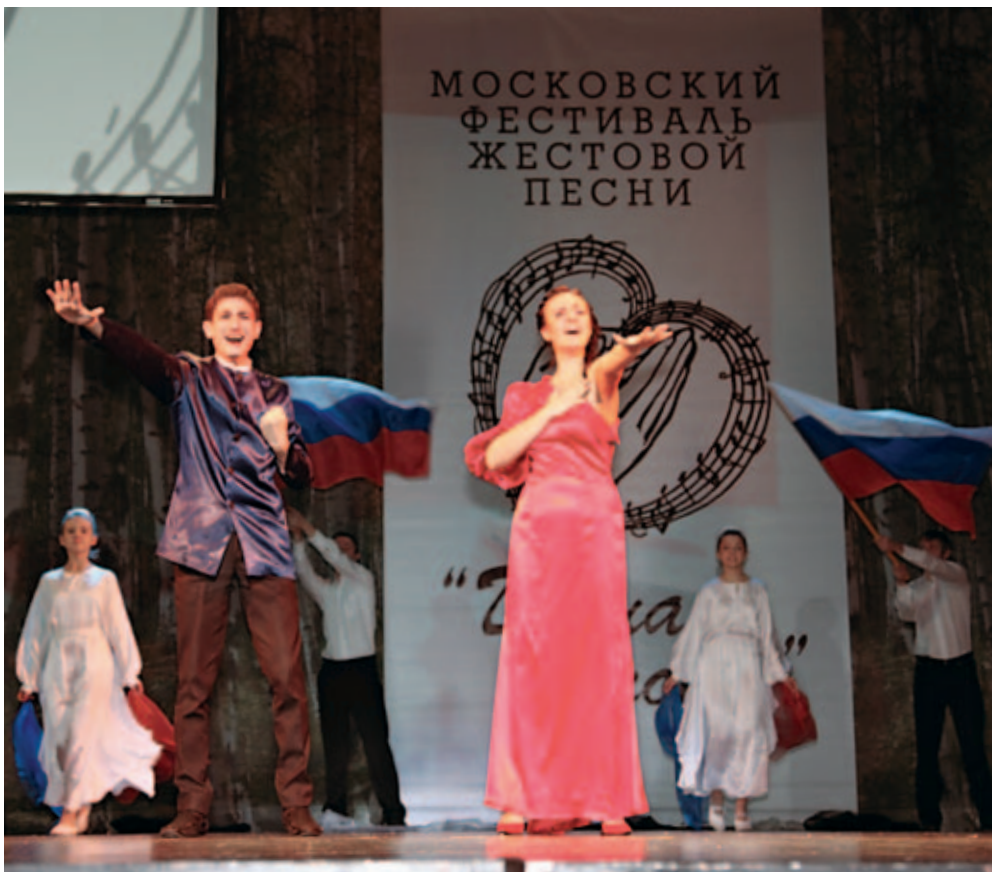
Творческое объединение «Лик» исполняет песню «Родина» (город Рязань)

«Гимн семье». Пары по очереди выходят на сцену. Девушки – в длинных вечерних платьях, молодые люди – в строгих костюмах. В середине песни к квартету присоединяется ещё одна пара, которая символизирует образы Петра и Февронии – прародителей праздника День