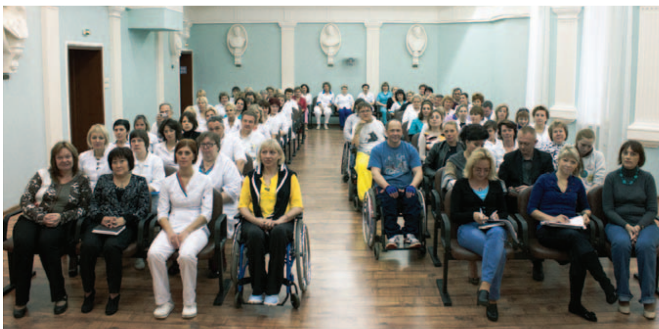
Участники конференции «Мир открыт для всех»