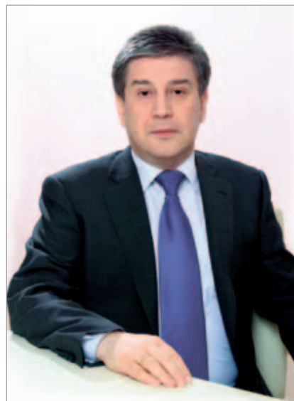
Руководитель Департамента социальной защиты населения города Москвы, министр Правительства Москвы Владимир Петросян

Руководитель Департамента социальной защиты населения города Москвы отметил, что сегодня деятельность подведомственных реабилитационных учреждений перестра-