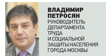
ВЛАДИМИР ПЕТРОСЯН РУКОВОДИТЕЛЬ ДЕПАРТАМЕНТА ТРУДА И СОЦИАЛЬНОЙ ЗАЩИТЫ НАСЕЛЕНИЯ ГОРОДА МОСКВЫ

Мы ведем свою работу по трем основным направлениям: социальные выплаты, организация социального обслуживания и оказания социальных услуг населению. И по всем этим направлениям есть устойчивая положительная динамика. Правительство Москвы постоянно принимает решения об увеличении размера социальных выплат. Не так давно минимальный социальный стандарт дохода московского пенсионера был повышен на 2,5 тысячи — сегодня он составляет 14,5 тысячи рублей.