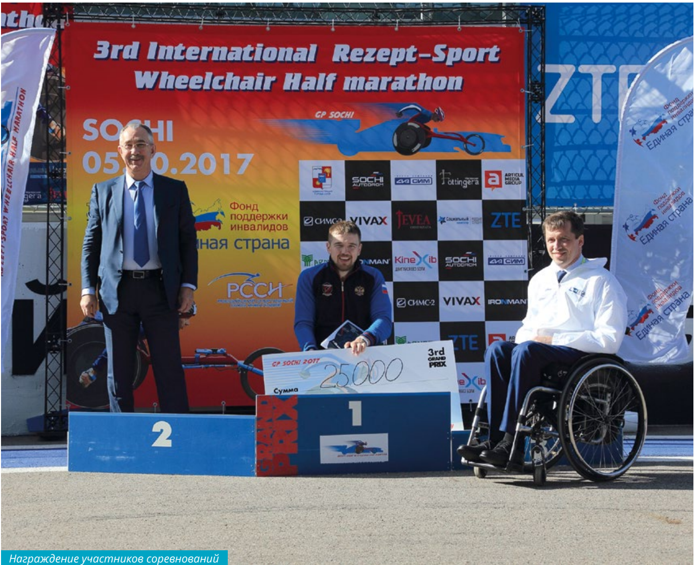
Награждение участников соревнований