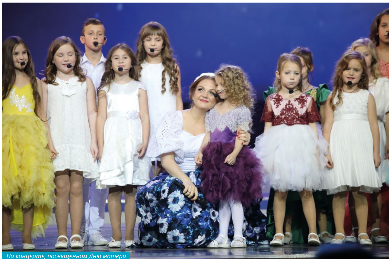
На концерте, посвященном Дню матери